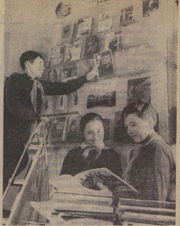
У ребят московской школы № 7 в библиотеке есть своё издательство «Маяк». — Какие книги выпускает оно? — спрашивает вы. Пионеры собирают вырезки из газет, журналов и делают книги. Их «вышла в свет» уже тысяча. В классах ребята устроили выставки книг о Владимире Ильиче Ленине. Есть и свои книгогощи. Они разносят книги взрослым читателям.