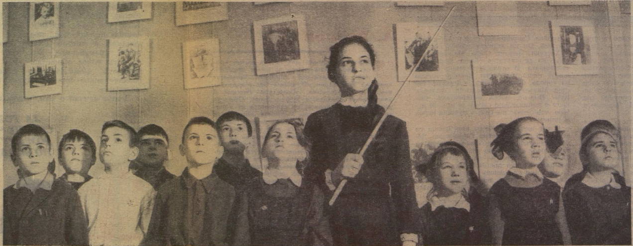
В этой комнате тихо даже тогда, когда галдят в школьных коридорах шумная перемена. Внимательно, серьёзно рассматривают ребята материалы ленинского музея. Слушают рассказ о жизни Владимира Ильича, о его делах и книгах.

Вот и стучит учащённо твоё сердце всякий раз, когда снова и снова убеждаешься в том, как близок людям Ленин, как тесно связано его судьба с судьбой народной, как любя и всегда помнят Ильича во всех уголках земли.